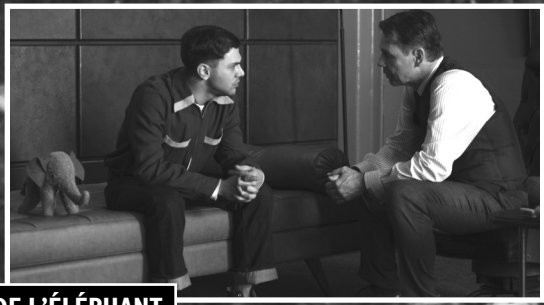
LA CHANSON DE L'ÉLÉPHANT